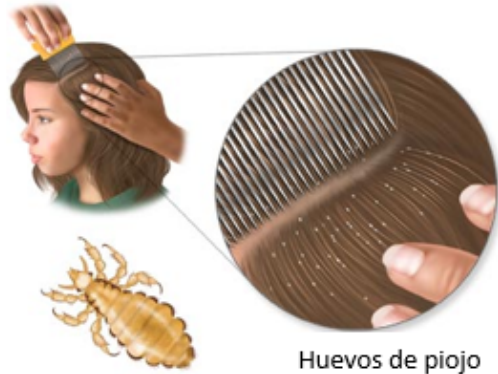
Piojo de la cabeza

Los piojos se conocen como una enfermedad molesta. El personal del Distrito Escolar de Jefferson tomará medidas inmediatas para reducir la exposición de los estudiantes a esta molesta enfermedad. Un estudiante identificado con un caso activo de piojos será excluido del salón de clases y enviado a casa para recibir el tratamiento adecuado. Se permitirá la readmisión a la escuela sólo cuando se haya asegurado el tratamiento adecuado y no se puedan encontrar piojos vivos.